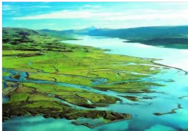
Ásýnd Lagarfljótsins mun breytast þegar öllu jökulvatni Jökulsár á Dal verður beint um jarðgöng til virkjunar í Fljótsdal og þaðan í fljótið.

Helgi segist hafa hvílt hugann við skógrækt og ekki síst þegar honum var þungt í sinni. "Það er mjög hollt og gagnlegt að stunda skógrækt og ég væri líklega dauður ef ég hefði ekki gert það. Dulspekingar segja að vættir séu í öllum trjám;